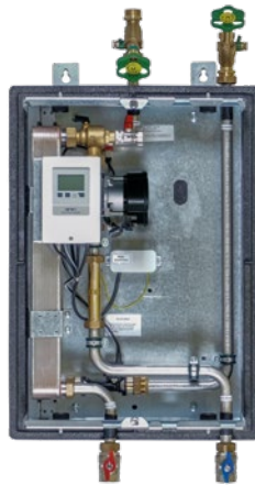
FW-E 40 Best-Nr. 1610001