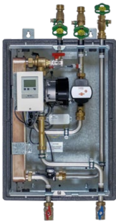
FW-EZ 40 Best-Nr. 1610003